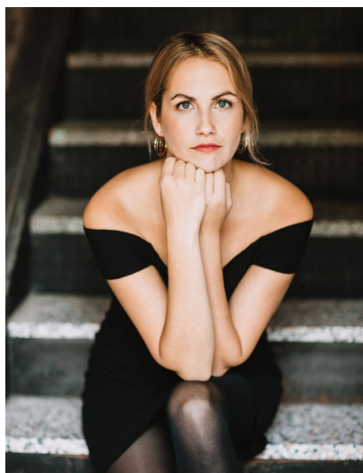
Florence Bourget

( http://smcq.qc.ca/smcq/fr/evenement/43254/Poesiole_Hommage_%C3%A