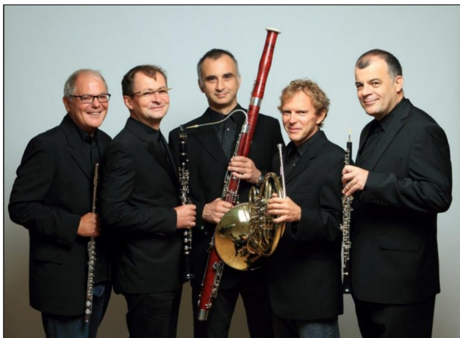
Les Slovènes du quintette à vent Slowind interpréteront notamment une pièce de leur compatriote et

De style contemporain, la composition s'inspire de l'histoire du point de vue de sa structure et de ses thèmes. Le début, énergique, est constitué de quatre thèmes tirés de chansons folkloriques de l'époque. Ils sont superposés pour recréer l'atmosphère animée et agitée qu'on retrouvait fort probablement sur ce genre de navire, avant que les thèmes se dégradent progressivement, subissant des altérations rythmiques et modales jusqu'à parvenir vers un pointillisme référant peu à peu à l'isolement qui suivra.